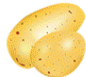
pomme de terre