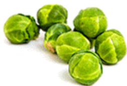
chou de Bruxelles